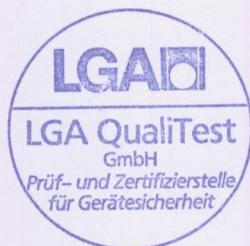
Bernd Rippel Prüfzentrum für Informationstechnik